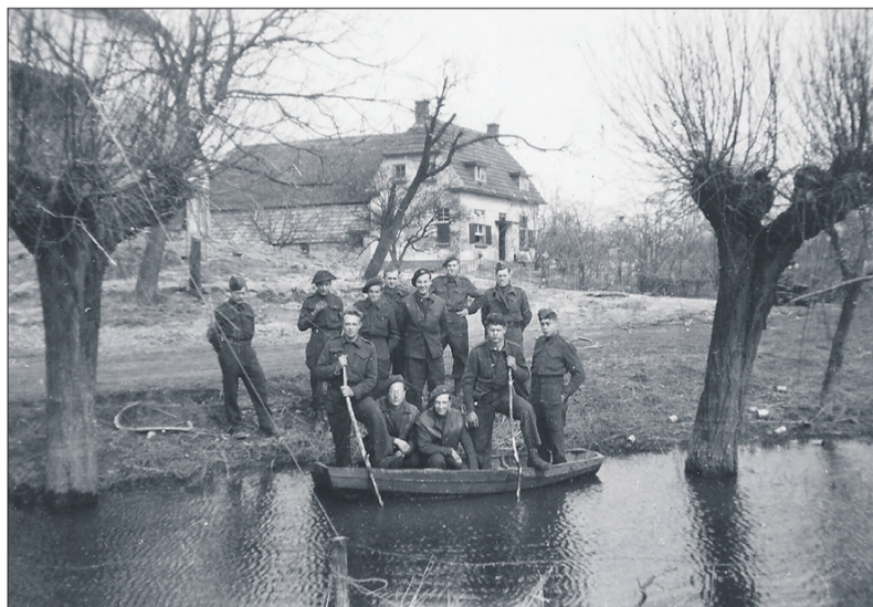
Een aantal Belgische militairen die in de polder waren ingezet om in de evacuatietijd de eigendommen van de bewoners te bewaken. Ze zitten in een bootje, want de Duitsers hadden besloten om de boel onder water te laten lopen door het doorsteken van de dijk bij Erlecom. De foto is gemaakt in Wercheren voor de Kleine Kuppenhof.

met hun oorlogsherinneringen, brieven dagboeken, foto's en andere documentatie te komen. Kijk eens op de zolder in kasten en laden. Wie weet wat er voor de dag komt. Ze doen dit graag en hebben intussen al een paar verhalen binnen. Dus de vraag is: "wie doet er mee?" Het is misschien wel de laatste kans om oorlogsverhalen uit de Ooij voor het nageslacht vast te leggen. Wie verhalen of foto's of misschien wel een oud dagboek uit die tijd heeft, mail het naar Wim Ebben, wimebben1221@upcmail.nl .