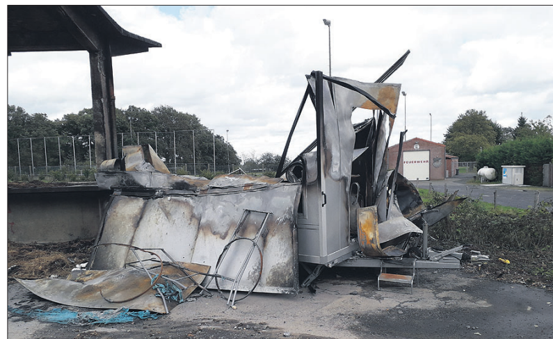
Het wrak van de uitgebrande snackkraam in Wyler, drie dagen na de brand.

Angelique en haar vriend zijn ook de uitbaters van lunchroom Juicy in Malden. De snackkraam in Wyler was een leuke activiteit erbij. Lekker makkelijk, dicht bij huis. Die droom is nu letterlijk in rook opgegaan. Komt er een nieuwe kraam? Angelique: "Dat weten we nog niet. Voorlopig moeten we eerst deze ellende verwerken."