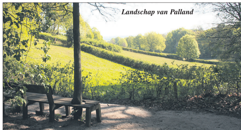
Landschap van Palland

Komt u een kijkje nemen in de nieuwe, mooie, grote Weggeefwinkel? Voor iedereen is er iets: dames kleding, heren kleding, kinder- en babykleding en ook voor schoenen, tassen en accessoires kun je terecht! Een kleine of een volle beurs, dat is niet belangrijk, de Weggeefwinkel is er voor iedereen!