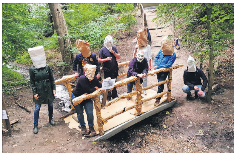
Een aantal leden van CV Occupy op het bruggetje