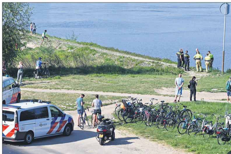
Politie en brandweer bij de Lindenberghaven aan de Waal

naast de Waalbrug, maar vertrokken even later weer, zonder in actie te komen. Diverse mensen bevonden zich, met dit warme weer, in het water, maar kennelijk was er niemand in nood. Ook de blusboot van de brandweer lag in de Lindenberghaven, maar ook deze hoefde niet in actie te komen.